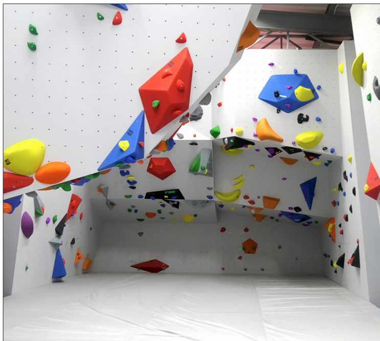
Новый скалодром, зона боулдеринга